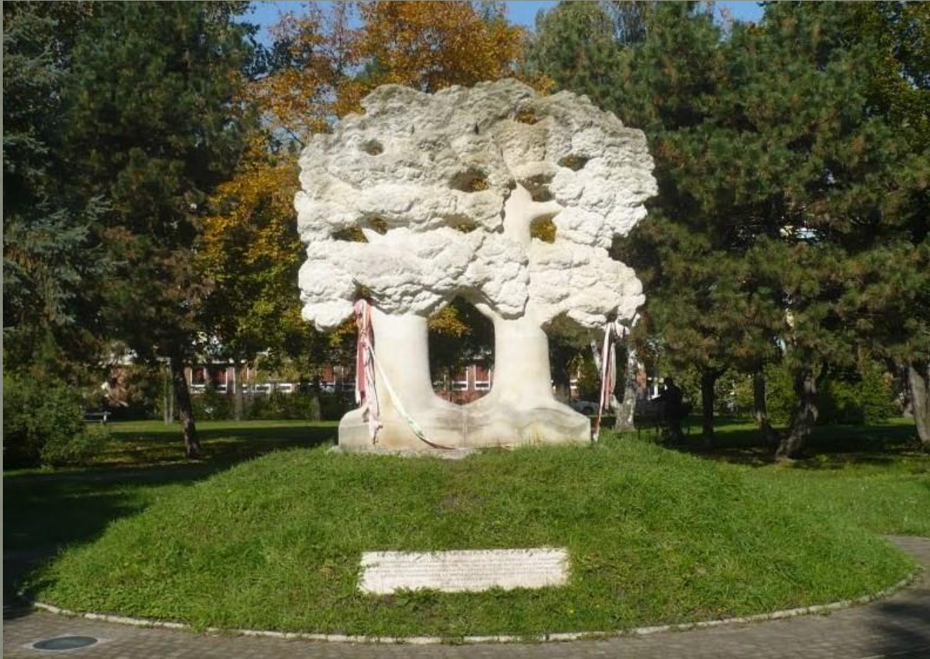
Denkmal der Polnisch-Ungarischen Freundschaft in Győr, Ungarn